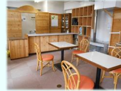
ヨベルまちづくりハウス 喫茶活動