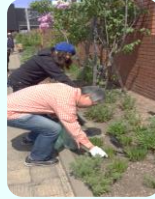
JR白石駅前 美化作業